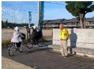
11/4 心と心をつなぐ挨拶運動