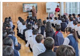
11/11 1年人権学習(聴導犬)