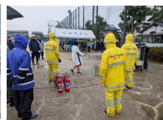
11/9 矢島防災訓練参加