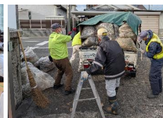
11/15～シルバーさん草刈り